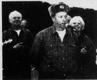
Håk an sjunger "Those were the days" i ryssmössa...