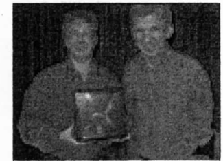
Nimrod knep vandringspriset