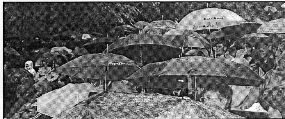
Festivalen blev ett äventyr i hållande regn.

Så var det då dags igen. September månad är här och tre nya medlemsmöten har vi att se fram emot under höstmörkret. Alla har vi väl glada minnen från Festivaldagarna. Synd att det regnade, sa en god vän som inte var med i Slotsskogen. Det bestående minnet för alla oss som var med blir väl ändå glädjen med musiken. Alla på scenen gjorde sitt allra bästa, från Ukulele Kids till proffsen från England. Så det där med regnet, inte var det någon stor sak. Tänk att publiken satt kvar i flera timmar. Dessutom såg de glada ut, det var det bästa betyget för Ukuleleklubben. Nu vet vi att det går att genomföra en Festival i hållande regn, nu är det gjort och får bli en erfarenhet. Tänk så många olika paraplyer det finns. När man blickade ut över publikhavet så var färgkaskaden en fantastisk syn. Red.