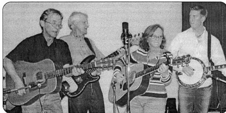
Kvällens succégrupp - Florence and the Nightingales

Nu går det inte att förtränga längre och låtsas som ingenting. Det är mörkt redan klockan sju på kvällen. Även om man väldigt gärna vill så kan man inte längre säga att det är sensommar. Det är höst. Så är det bara! Det gäller att hitta något positivt med detta. Svårt så där direkt, men med lite eftertanke så går det. Just där var ordet. Hösten är tiden för eftertanke. Vi får tid att sänka takten och besinna oss. Tid till eftertänksamhet. Det ligger något stort och fridfullt i det. Hösten är också planernas, föresatsernas, viljornas och beslutens tid. Kanske skall man gå den där kursen man tänkt på så länge. Eller verkligen träna på ukulelen tjugo minuter varje kväll, före Rapport. Se där, så snabbt blev hösten möjligheternas tid. Red.