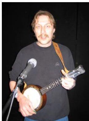
Pelle med banjolele

du gav mig ett bra tips om en stämmare ”den lilla myggan” som jag inte klarar mig utan.