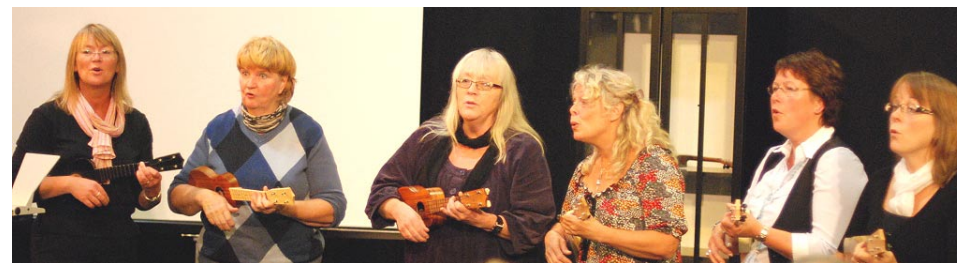
Ukulele ladies på öppen scen