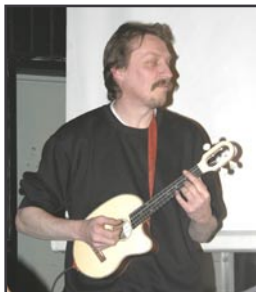
Pelle med Risa-ukulele