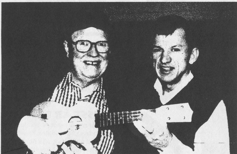
Povel Ramel - århundradets glädjespridare - får hjälp med ackorden....