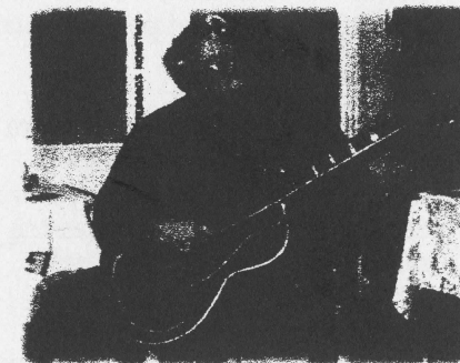
Bert med sång & gitarr á la Mills Brothers!

UkuleleKlubben - föreningen för utvärtes beundran!