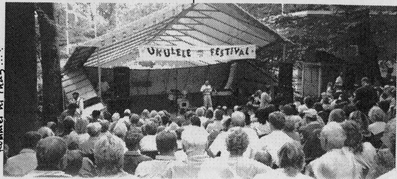
Kommer ni ihåg...?