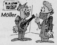
Vid tangentbordet: Olof Möller

Så ukken fungerade som smärtstillande medicin. Märkligt men positivt, vad musik kan göra. Så sensmoralen måste vara: spela ukke, sjung och håll dig frisk.