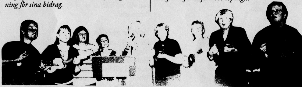
"I love coffee, I love tea..." - Ukulele Ladies imponerar igen...