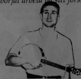
Anders A. imponerade stort med en Formbylåt...

Vi har varit dånliga på att uppmärksamma alla malajer genom åren... Men nu utbrister vi: Tack, alla malajer för alla goda smörgåsar ni gjort! Det betyder så mycket för oss andra. Det är härligt att se den febrila aktivitet som utbryter i köket timmen innan klubbträffen. Kaffe bryggs, smörgåsar breds, servisen dukas ut... Nu har malajerna utökats till fyra stycken - just för att vi är så många på klubbträffarna numera!