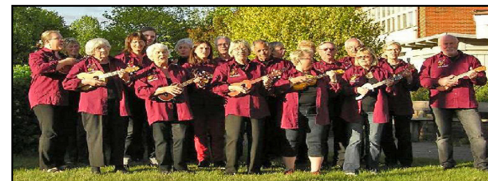
Full fart på ukulelelirandet i Lerum. Det är underbart med entusiaster i farten!