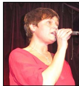
Karin Klingenstjärna till kaffet!

Till kaffet blev vi överraskade av ett glatt och duktigt musikerpar, kända från tv: Karin Klingenstjärna med pianist.